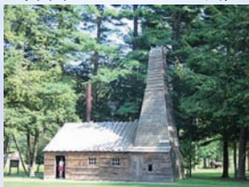
世界初の石油坑井 (米国ペンシルベニア州)