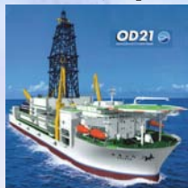
地球深部探査船 「ちきゅう」